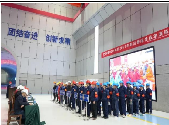
开展防汛暨综合应急演练