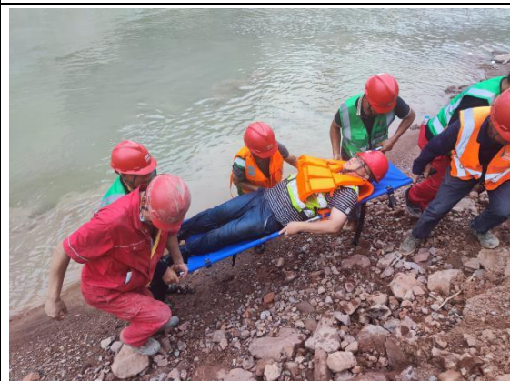
开展人员溺水应急演练