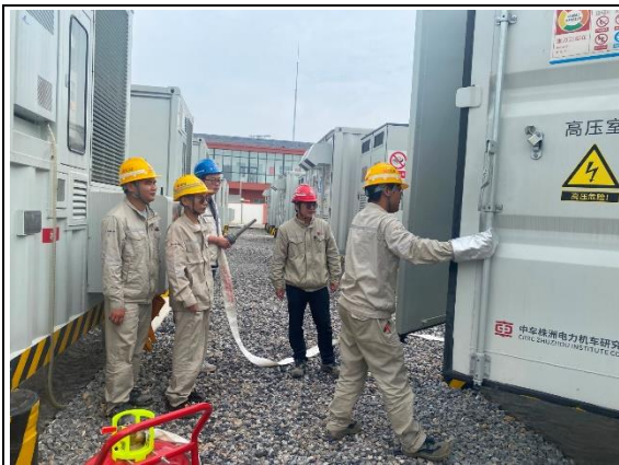
储能电站消防应急演练