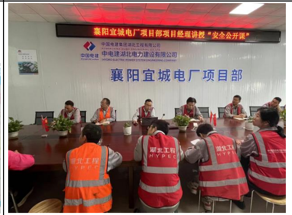
项目经理开展安全生产公开课