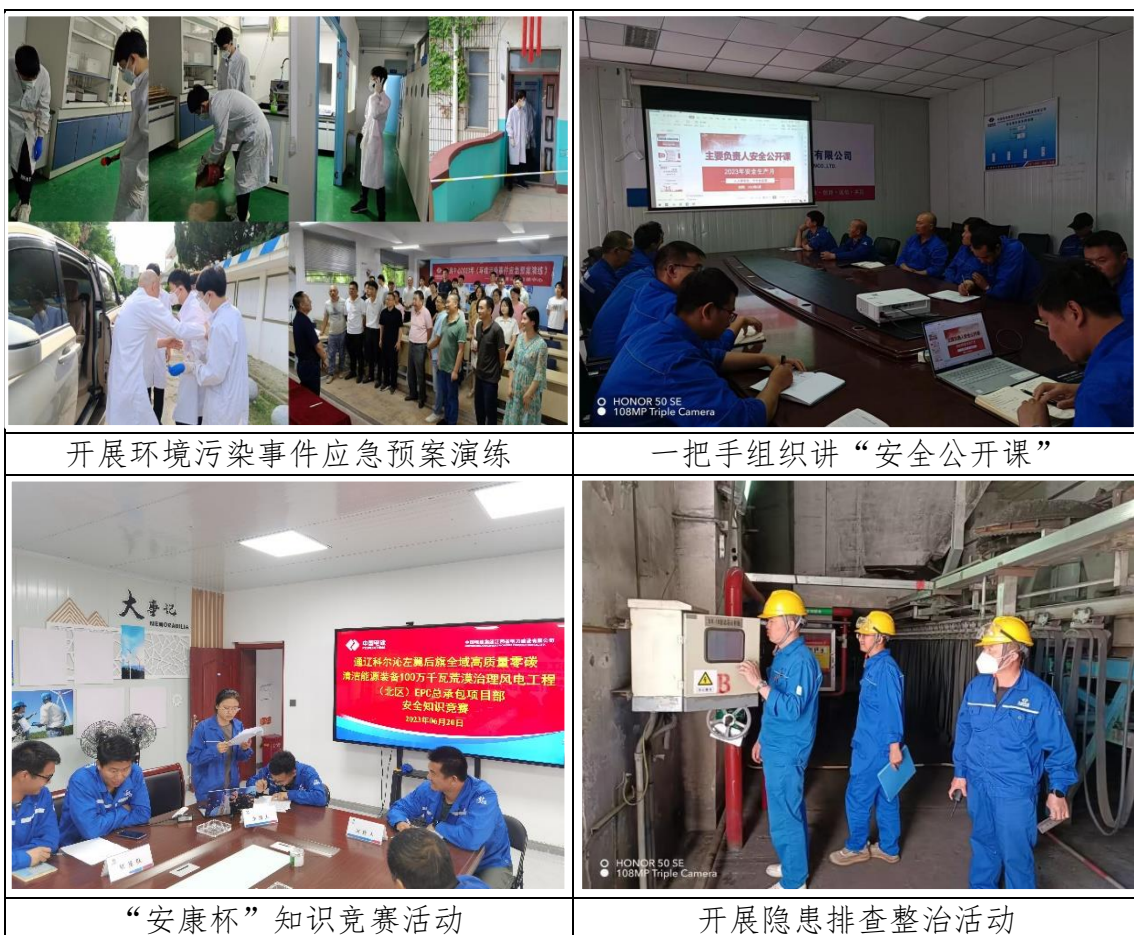
开展环境污染事件应急预案演练

夯实全员安全生产责任制基础。积极组织开展隐患排查整治，对现场动火、临电、高处等危险作业进行检查，重点对作业许可审批、监护人设置、特种作业人员持证上岗、作业人员个体防护、安全措施落实、工器具操作规程执行情况等进行检查。