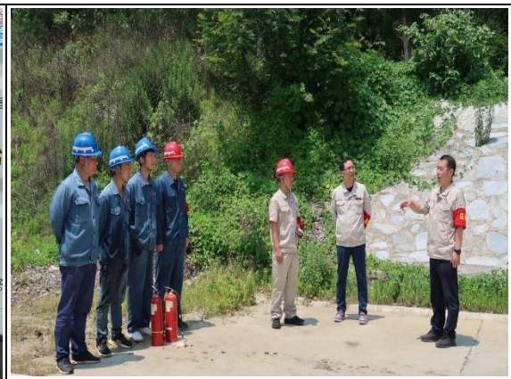
光伏电站消防应急演练