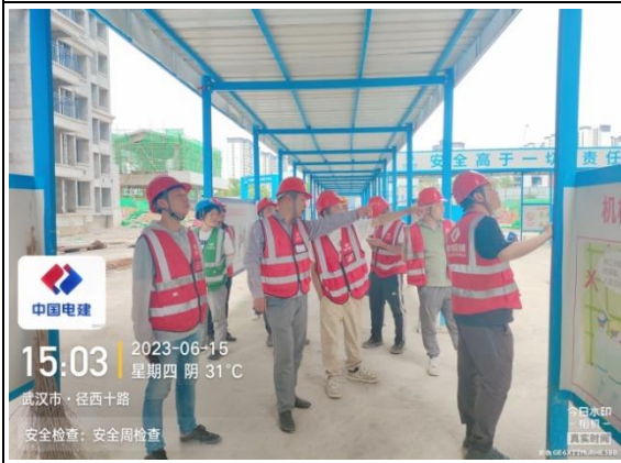
负责人带队检查活动