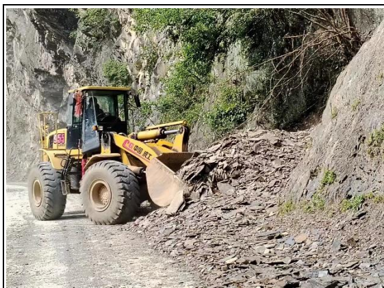
进场道路紧急清障