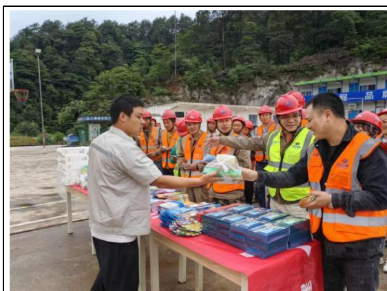
现场安全宣传咨询活动

该公司积极组织各参建单位开展“6·16 安全宣传咨询日”活动，通过张贴公益海报、发放安全应急资料和播放专题宣传片等方式，开展参建工人喜闻乐见、形式多样的安全宣传咨询活动。重点宣传安全生产方针政策、法律法规、全国重大事故隐患专项排查整治 2023 行动，以及安全避险逃生技能等安全知识。结合近年来行业及地区发生的突发事件，组织开展森林火灾、防汛防溺水、地下厂房火灾及高处坠落等具有针对性的应急演练，重点加强人员安全自救互救能力建设，有效提高参建工人应急救援、应急逃生等应急避险意识和能力。