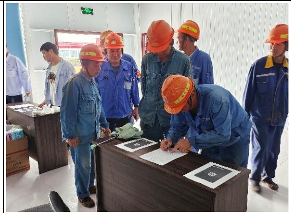
开展有奖竞答活动