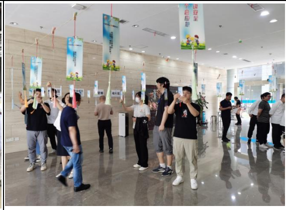
安全知识竞赛活动