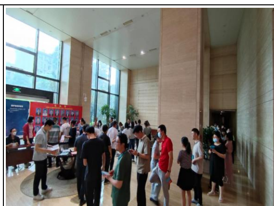
广大职工排队入场参加活动