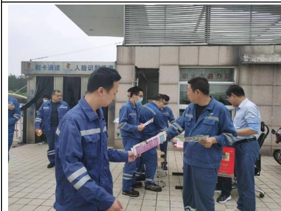
向职工派发安全月宣传单