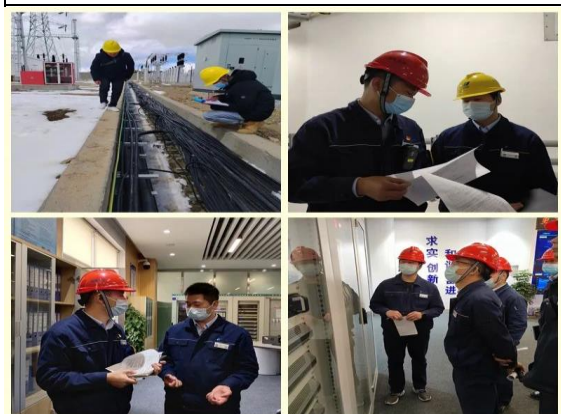
开展“动态化、全覆盖、无死角” 隐患排查