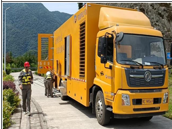
全厂失电状态下溢洪道应急启闭