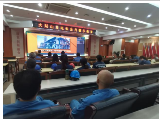
安全警示教育活动