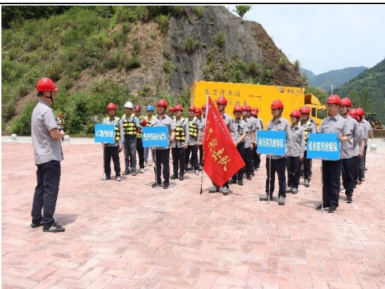
召开演练现场总结会