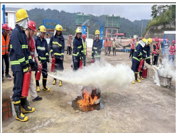
开展森林防火演练