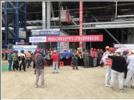
开展安全咨询日活动