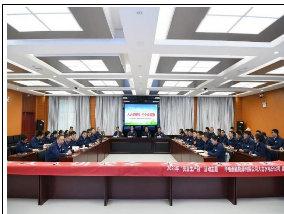
安全生产月启动会议

堵漏洞。各所属基层企业坚持“点、线、面”结合，全方位开展安全生产常规检查、汛期雨季特定时段动态检查，坚持逢停必检、逢修必检，深入推进隐患大排查大整治，做到监督检查“动态化、全覆盖、无死角”。三是强化应急演练提能力。结合安全生产月主题，树牢“防大汛，抢大险，救大灾”思想，开展防洪度汛应急演练。分别设置局部暴雨、厂用电中断、人身触电事故、厂房超设计标准洪水四个演练场景，全方位展现预警预报、应急避险、应急救援等演练内容。通过演练增强生产一线员工防汛抢险意识，提高公司系统性应对突发事件能力，为今后迅速应对汛期各类复杂险情提供了宝贵实战经验。