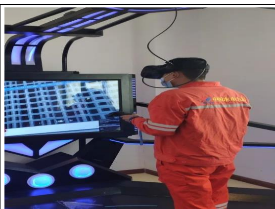
运用VR（虚拟现实技术）、HCI（人机交互）等多种形式丰富活动载体