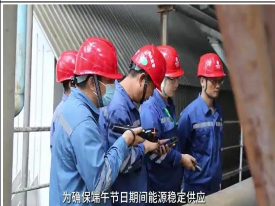
开展无死角安全生产隐患排查