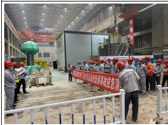
开展防高处坠落事故应急演练